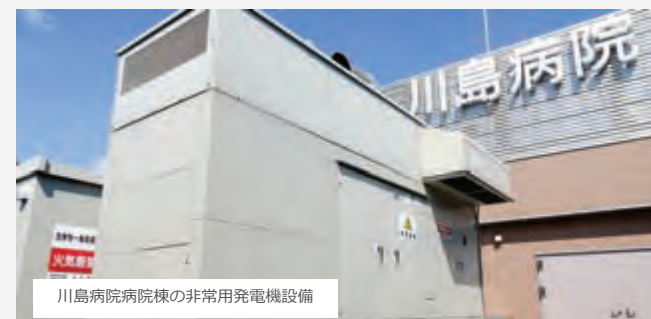
川島病院病院棟の非常用発電機設備

予期せぬ事故や災害が発生し、建物への電力供給が停止された時に電力を供給する設備です。川島病院では、津波等の影響を受けない屋上に設置し、病院棟に1台、透析棟に2台設置しています。病院棟では災害時の停電でも検査などができる電力を供給できます。また、透析棟でも透析に必要な電力の確保ができる発電機を設置しております。