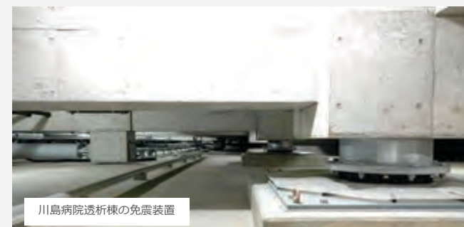
川島病院透析棟の免震装置

川島病院病院棟は1階と2階の間に、透析棟は基礎部分と地盤の間に免震装置があります。